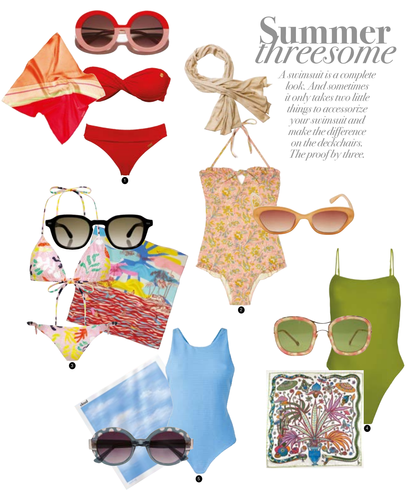
1) Maillot de bain 1 pièce en lycra, Chlore , 130 euros / Solaires en poudre de polyamide et branches en titane, VM L'Atelier , 275 euros. / Foulard en soie marguerites, Vilebrequin , 160 euros. // 2) Maillot 1 pièce Villa Cavois flower, Chlore , 110 euros. / Solaires en acétate modèle Kubrick Sun en édition limitée, Etnia Barcelona , 259 euros. / Fouta baignade blush, Mapoésie , 79 euros. // 3) Haut de bikini 99,90 euros, Culotte de bikini 44,90 euros, Prima Donna . / Solaires en acétate, Lanvin , 350 euros. / Bandana twill de soie, Malfroy , 50 euros. // 4) Maillot de bain 1 pièce décolleté plongeant, Prima Donna , 99,90 euros. / Solaires en bétatitane monture Louie, Waiting for the Sun , 180 euros. / Foulard Cerelus, Cop Copine , 39 euros. // 5) Haut de bikini à nouer tie & dye 75 euros, Culotte de bain à nouer tie & dye 65 euros, Esquisse . / Solaires en acétate, Jimmy Fairly , 149 euros. / Carré imprimé géométrie fleurie 120/120cm, Eric Bompard , 265 euros.

A swimsuit is a complete look. And sometimes it only takes two little things to accessorize your swimsuit and make the difference on the deckchairs. The proof by three.