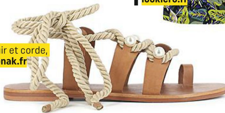
Nu-pied en cuir et corde, Jonak, 85 €. jonak.fr

Influencé par le défilé Valentino, l'imprimé luxuriant végétal s'impose cet été avec panache ! Oiseau exotique et maxi fleurs s'associent à un maillot de bain sobre et élégant. Une mode estivale qui oxygène notre quotidien.