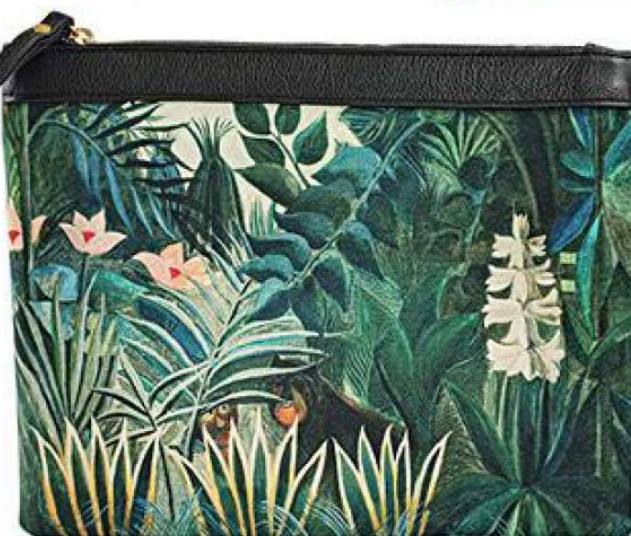
Pochette en coton, Rayon d'Or, 9 €. rayondor-bagages.fr