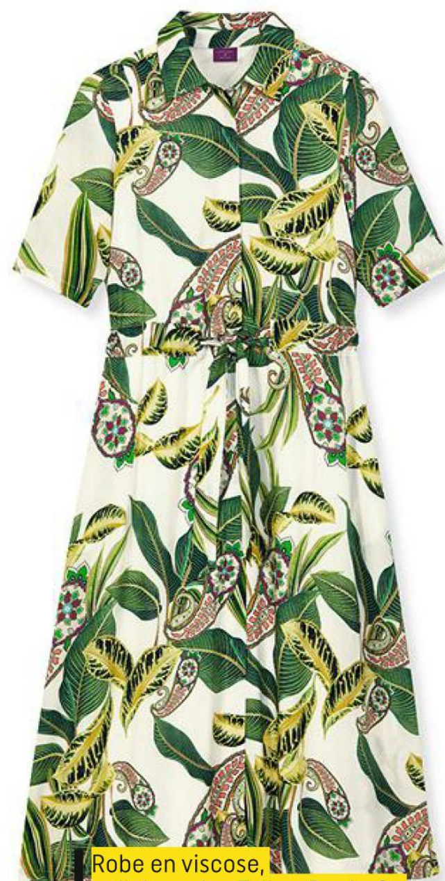
Robe en viscose, collaboration Talbot Runhof x Madeleine, 349,95 €. madeleine.fr