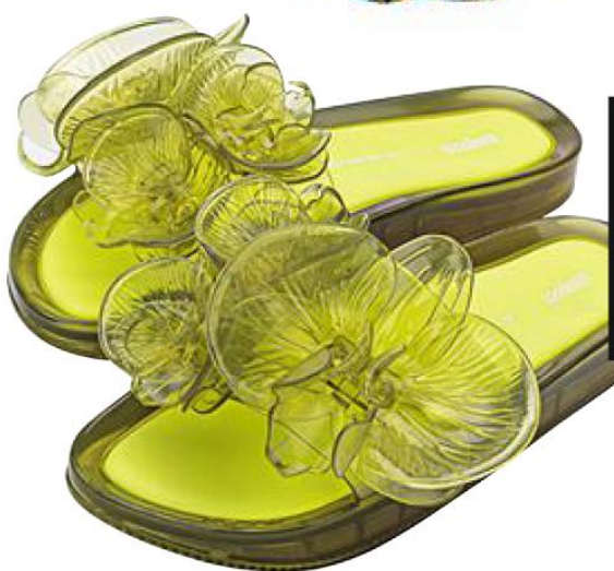
Nu-pieds en Melflex, 100% plastique recyclable, Melissa + Y/Project, 129 €. melissashoes-france.com