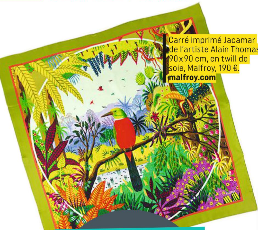
Carré imprimé Jacamar de l'artiste Alain Thomas, 90x90 cm, en twill de soie, Malfroy, 190 €. malfroy.com