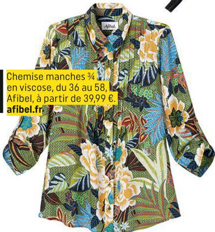
Chemise manches 3/4 en viscose, du 36 au 58, Afibel, à partir de 39,99 €. afibel.fr