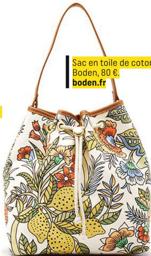
Sac en toile de coton, Boden, 80 €. boden.fr