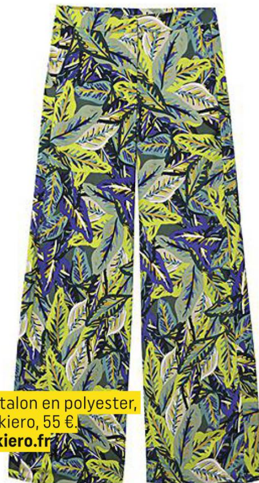
Pantalon en polyester, Lookiero, 55 €. lookiero.fr