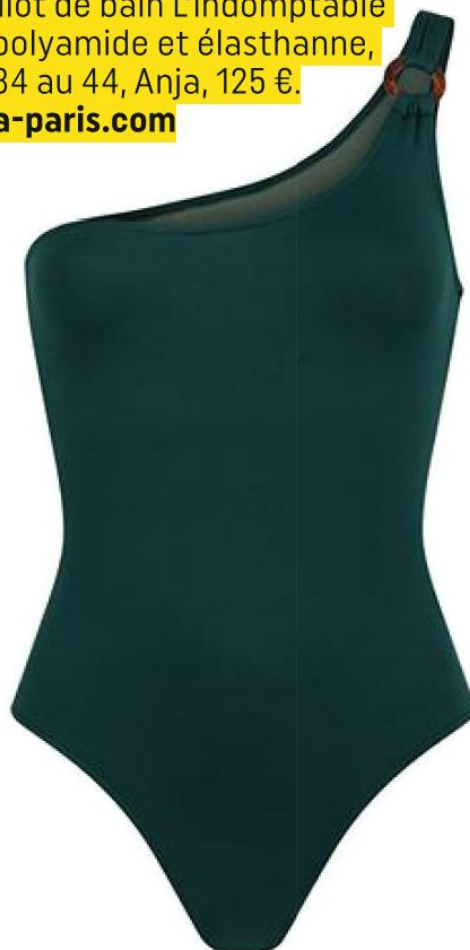
Maillot de bain L'indomptable en polyamide et élasthane, du 34 au 44, Anja, 125 €. anja-paris.com