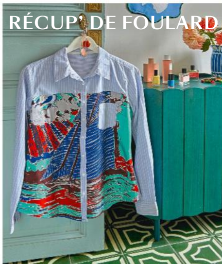
RÉCUP' DE FOULARD