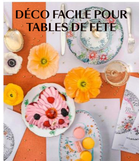
DÉCO FACILE POUR TABLES DE FÊTE