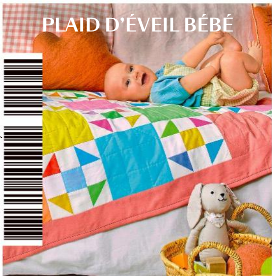
PLAID D'ÉVEIL BÉBÉ