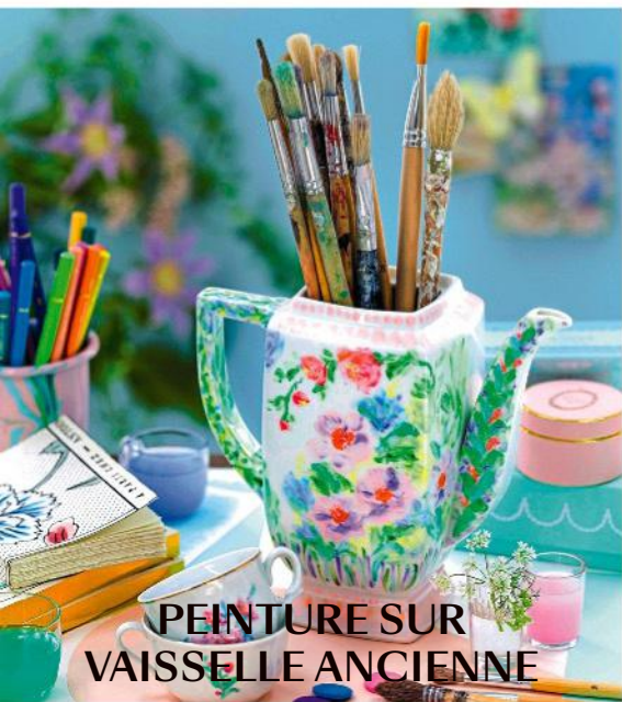
PEINTURE SUR VAISSELLE ANCIENNE

LA DÉCO PASSE AU VERT RECYCLER, CUSTOMISER, JARDINER, DÉTOURNER, CRÉER, TRANSFORMER... LES BONS RÉFLEXES DIY À ADOPTER POUR UNE MAISON ÉCORESPONSABLE