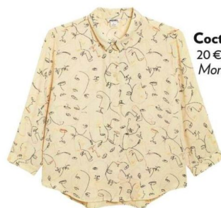
Cocteau. 20 €, Monki.