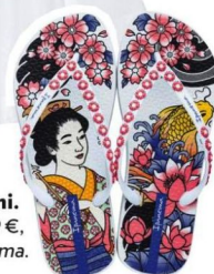
Irezumi. 29,99 €, Ipanema.