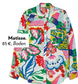
Matisse. 85 €, Boden.