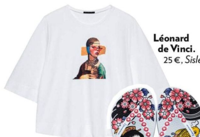
Léonard de Vinci. 25 €, Sisley.