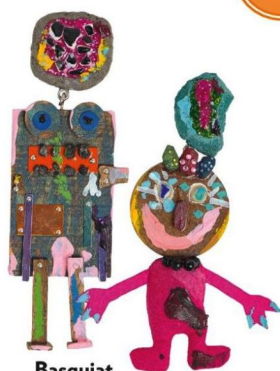
Basquiat. 80 €, Bimba Y Lola.