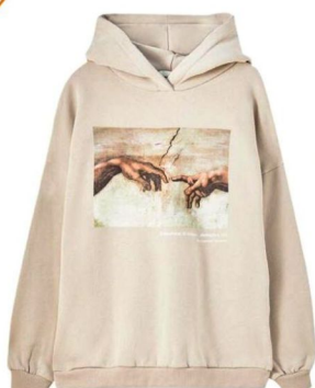
Michel-Ange. 29,99 €, Pull & Bear.