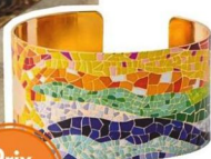
Gaudi. 14,90 €, Balaboosté.